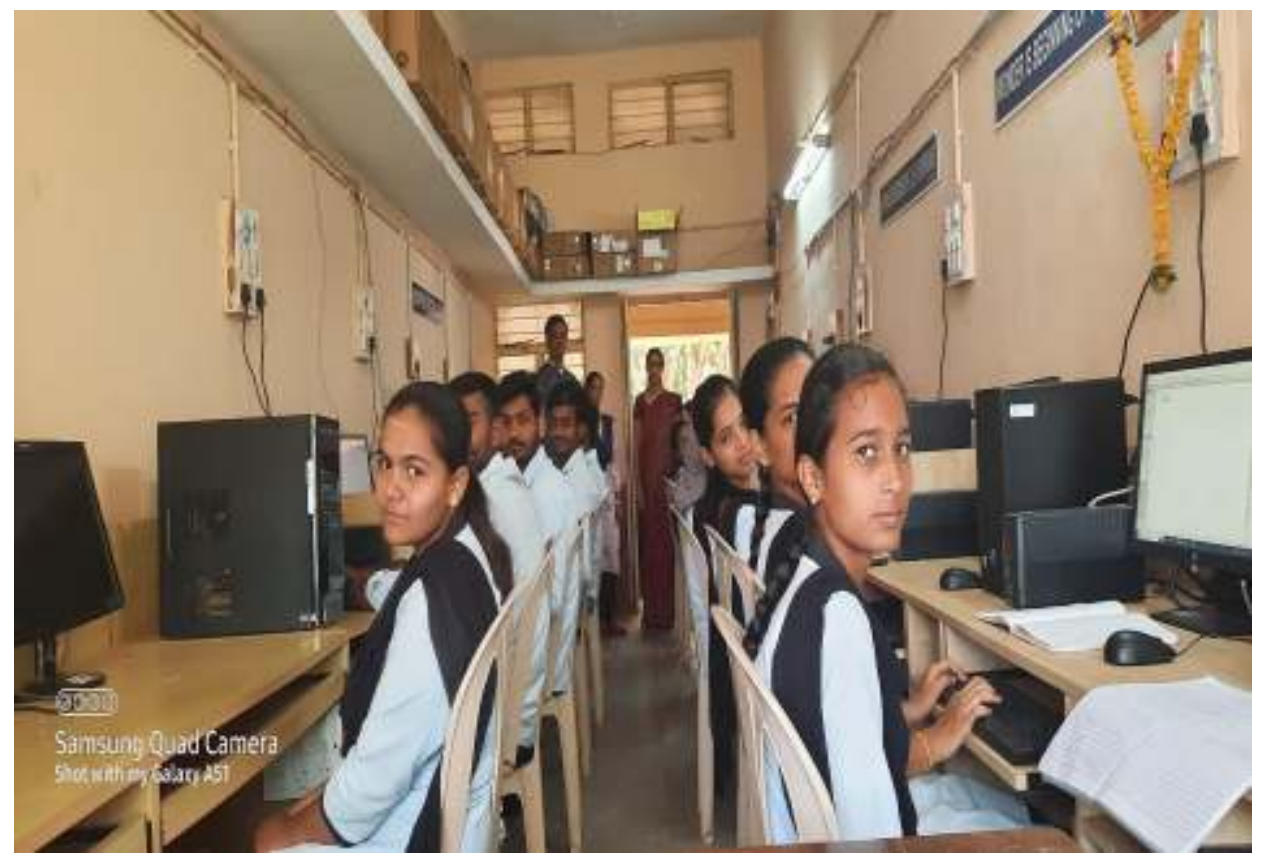
Computer Science Lab